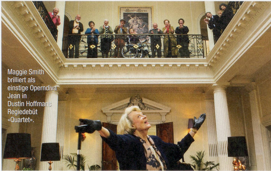
Maggie Smith brilliert als einstige Operndiva Jean in Dustin Hoffmans Regiedebüt «Quartet».