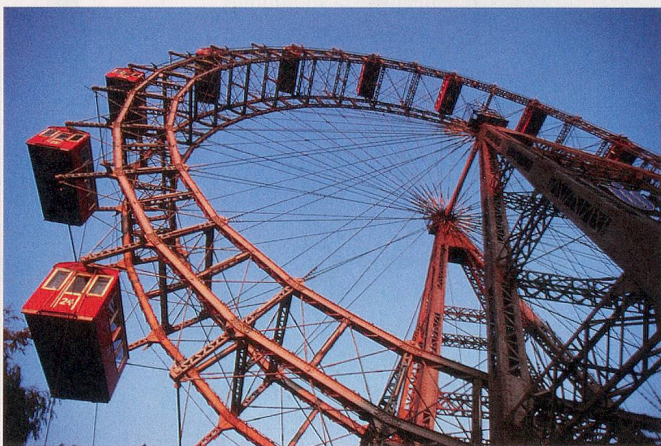
Drei besondere Attraktionen der Zeitlupe-Reise nach Wien: die farbenfrohen Verlockungen der k. u. k. Hofzuckerbäckerei Demel (Bild ganz oben), die Freiluftbühne St. Margarethen im Burgenland (Bild links) und das berühmte Riesenrad im Prater.

zwei Millionen Einwohnern die fünft-grösste Stadt der Welt.