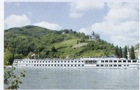
4**** Boutiqueschiff MS Rembrandt van Rijn