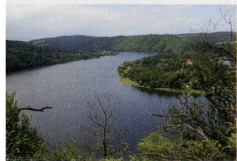
Flusslandschaft Obere Moldau