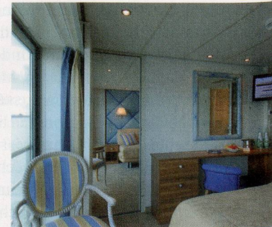
2-Bettkabine Deluxe Oberdeck mit franz. Balkon

Mitteldeck vorn 1590.- / Oberdeck Deluxe 2090.-