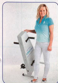
Einfach und leicht zu transportieren

Hält Sie aktiv, fit und beweglich bis ins hohe Alter Schont Gelenke und Knochen – ohne Sturzgefahr Seit 20 Jahren erprobt von Senioren und Reha Kunden