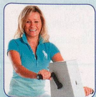
Nur Arme bewegen