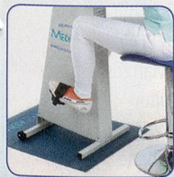
Nur Beine bewegen