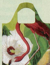
«Loqi»-Tasche «Botany Flamingo»

Bestellatalon gleich ausfüllen und einsenden an: Schweizer Garten, Abo-Service, Postfach 277, 3084 Wabern, Telefon 031 960 20 77, Fax 031 960 20 78, aboservice@schweizergarten.ch / www.schweizergarten.ch