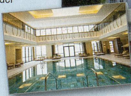
Wald & Schlosshotel Friedrichsruhe GOLF, WELLNESS UND SPA

So nehmen Sie an der Verlosung teil: Telefon: Wählen Sie die 0901 500 086 (CHF 0.90/Anruf ab Festnetz). SMS: Senden Sie WORT gefolgt vom Lösungswort, Ihrem Namen und Adresse an die 970 (CHF 0.90/SMS). Beispiel: WORT AUTO Hans Muster Musterstrasse 1 8000 Zürich Postkarte: Senden Sie diese mit dem Lösungswort an: Zeitlupe, Rätsel, Postfach, 8074 Zürich. Teilnahmeschluss: 20. Mai 2013