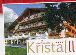
(Einlösbar von So bis Fr)

1 × 2 Nächte für 2 Pers. im Verwöhnhotel Kristall im Wert von ca. CHF 750.–!