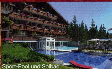
Sport-Pool und Solbad