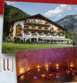
(Einlösbar von So bis Fr)

1 × zwei Nächte für 2 Personen im Verwöhnhotel Kristall in Pertisau im Wert von ca. CHF 750.–! Kristä[ll]