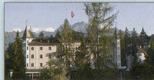
Gültig bis 13. Oktober 2014