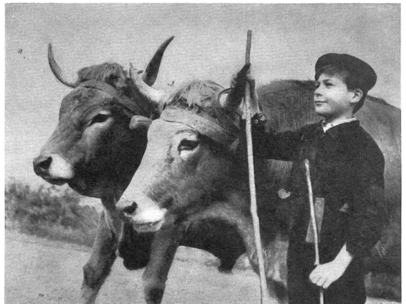
Bild rechts: Der zukünftige Erbe des Hofes — auch er stellt im Film nur dar, was er auch im Leben ist, wie die übrigen Mitwirkenden. («Farrebique», Neofilm-V.)

Bild links: Zum letztenmal streicht der Grossvater über die Pflugschar, bevor er sich zum Sterben niederlegt. («Farrebique», Neofilm-V.)