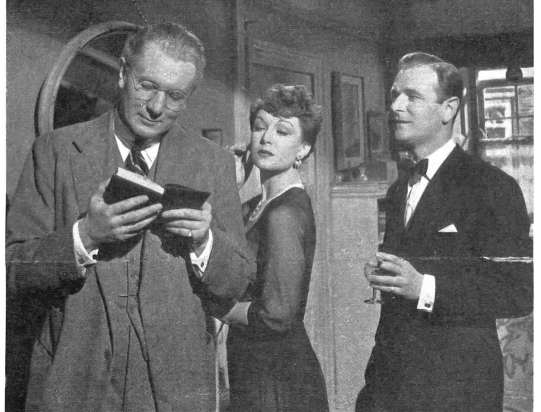
Bild Mitte: Er muss den Beifallsturm für die Abschiedsworte eines jüngeren und beliebten Lehrers abwarten, bevor er mit einer ergreifenden Beichte beginnen kann.