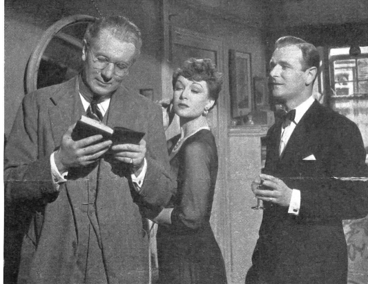
NEUE FILME THE BROWNING VERSION Bild links: Der unbeliebte Lehrer dreht sich in der Klasse scharf um, um festzustellen, ob ein Schüler hinter ihm Gesichter schneide. (Rank-Film) Bild rechts: Er freut sich an der «Browning version», die ihm ein Schüler zum Andenken geschenkt hat, während seine Frau sich ausdrückt, ihm die Gabe zu ver gössen. (Rank-Film) Bild Mitte: Er muss den Beifallsturm für die Abschiedsworte eines jüngeren und beliebten Lehrers abwarten, bevor er mit einer ergreifenden Beichte beginnen kann. (Rank-Film)