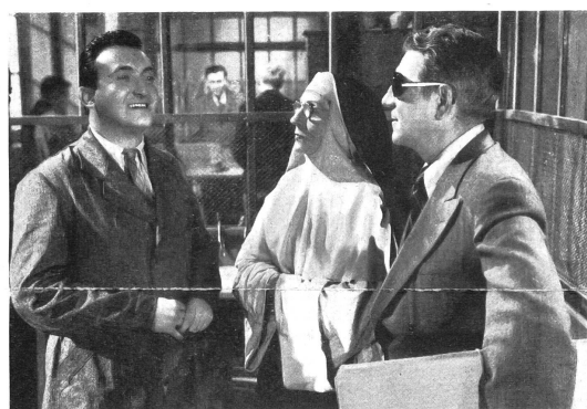
Es gelingt, ihm mit List ins Schulungszentrum für Blinde zu bringen, das ihm zum Sidisakt wird.

matie und List gibt er seine Zustimmung zum Eintritt in ein Schulungszentrum für Blinde, in dessen brüderlicher Atmosphäre er sich bald wohl fühlt. Dort fasst er auch eine Zuneigung zu einer blinden Lehrerin, deren sehender Bräutigam, Wirtschaftsleiter des Zentrums, ihm jedoch aus Eifersucht verrät, dass keine Hoffnung mehr für ihn bestehe, jemals geheilt zu werden. Der harte Schlag treibt ihn zum Selbstmordversuch, um dann jedoch endgültig die Lehrerin mit dem festen Willen an seine Seite zu bringen, ein gemeinsames Glück auch im Dunkel der Nacht aufzubauen. Die Kunst Jean Gabins in der Hauptrolle, von dem es einst hiess, er spiele in keinem Film, in welchem er nicht eine Ermordung darstellen könne, gibt dem Film eine männliche Beherrschtheit, und ver-