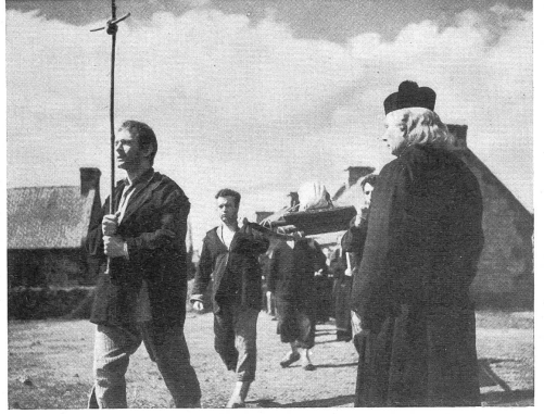
Bild links: Die Kirche und davor die wartende, verlassene Herde — ein Beispiel für die symbolische Kraft des Bildersprache aus dem Film «Gott braucht Menschen». Bild rechts: Die beiden feindlichen Mächte begegnen sich: Der allen katholischen Grundsatzen zuwiderhandelnde Laien-Priester (Grossartig dargestellt von dem Protestanten Fresnay) führt mit dem Kreuz den Beerdigungszug des Selbstmörders an, dem der starre Vertreter der offiziellen Kirche (rechts) den Friedhof verweigert. (Verleih: 20th Century Fox-Film.)

des Geistlichen und seines Amtes dreht, bietet viele wichtige Ausblicke, von denen zu hoffen ist, dass sie von unseren Filmbesuchern nachhaltig diskutiert werden. Wir können sie in dieser Voranzeige in ihrer Reichhaltigkeit nicht einmal andeuten. Der Film ist von Protestanten gestaltet worden, was man ihm deutlich anmerkt, wenn er auch gemäss der Buchvorlage dem Boden der katholischen Orthodoxie verhaftet