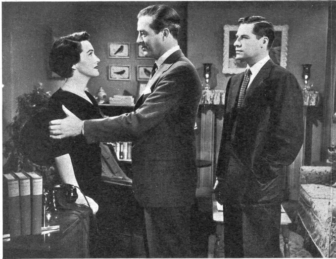
Der Professor, der durch ein Unglück Frau und Kinder verloren hat und den Verlust nicht überwinden kann, lehrt die Hilfe der Braut seines Freundes ab. Ihre besorgte Anteilnahme beunruhigt den Bräutigam, so dass das Verlöbnis zweier glücklicher Menschen in die Brüche zu gehen droht.