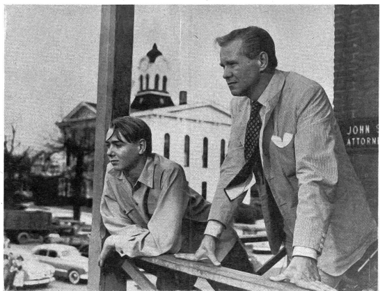
Der Anwalt und ein Freund schauen dem als schuldlos befundenen Neger ergriffen nach. Sie sind sich einig, dass der verachtete Neger der «Hüter ihrer Gewissen» ist.

eine Verkettung verschiedener Umstände wird der Tote gefunden. Dabei stellt sich heraus, dass die Kugel mit Sicherheit aus einem fremden Gewehr stammt. Der befreite Angeschuldigte, der den Täter kennt, verweigert aber den Namen. Durch eine List kann der Polizeichef schliesslich den Schuldigen herausfinden. — Die Hintergründig-