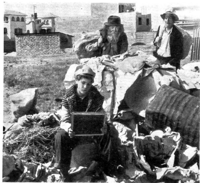
(LOS OLVIDADOS) DIE VERGESSENEN

Z. Das alte Nachkriegsthema der verwahten Jugend hat hier noch «Sciucias» und «Irgendwo in Europa» eine weitere hervorragende Verfilmung erfahren. Mexikanische Jugendliche wachsen auf sich allein angewiesen in unvorstellbarer Armut und Unwissenheit auf, wohnen in Rümpfen mit Erwachsenen und Tieren zusammen und leben als Analphabeten von bandedmässigen Ueberfällen, wobei sie früher oder später ein gewaltsamer Tod im Streit oder durch polizeiliche Verfolgungen ereilt. Alle normalen Bindungen fehlen. Die Leidenschaften sind denkbar primitiv und werden tierisch ausgelebt, Rachsucht, Grausamkeit und Gier. Die Menschen haben sie vergessen, und sie haben vergessen, dass sie Menschen sind. Sie fühlen sich zu nichts verpflichtet, weil die Gesellschaft sich auch ihnen gegenüber zu nichts verpflichtet hat. Sie tritt ihnen nur feindlich entgegen. Wohl sieht man in den Häusern das