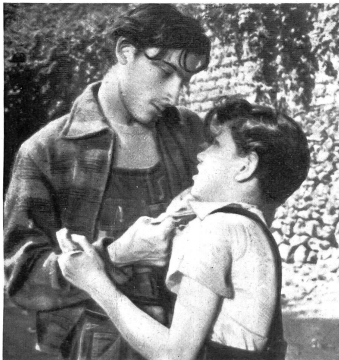
Bild links: Einer der Jungen findet beim Durchwühlen eines Abfallhaufens ein Bild; zwei erwachsene Vagabunden wollen es ihm entreissen (Film «Die Vergessenen»). — Bild links unten: Ein blinder Bettlermusikant entdeckt einen von einem an-

dern Jungen Erschlagenen. — Bild rechts: Der Täter droht einem Mitwissenden, ihn ebenso zu ermorden, wenn er nicht schweigt. (Verleih: Präsens-Film)