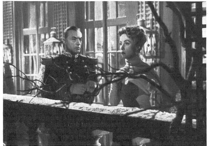
Der General und seine Frau, die spüren, daß sie mehr zueinander gehörten, als sie glaubten, sprechen sich aus.

Ein Melodrama? Gewiß, so erzählt. Aber Ophuls nimmt dieser Geschichte alle Schwere, alles Pathos, allen Ueberschwang. Er dichtet eine Ballade von innigster Schwermut, und wenn er die Lichter der Ironie, der träumerischen Verspieltheit setzt, dann kann das nur den von der tieferen Wahrheit dieses Geschehens ablenken, der nicht wil-