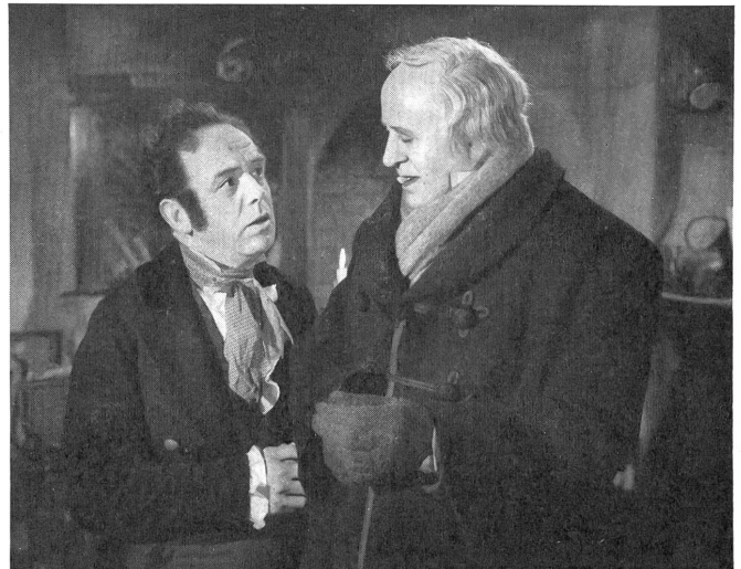
Der alte Geizhals gönnt seinem Angestellten nicht einmal den freien Weihnachtstag.

So etwa reden die Menschen von heute und bringen sich dabei nicht nur um die Bekanntschaft mit einem schönen Werk, sondern versagen einmal mehr vor einem guten Film, entmutigen Kinos, Verleiher und Hersteller. Denn dieser Film ist gut, erhebt und interessant zugleich. Nicht nur, weil er von einem echten Dichter stammt, so daß ihm der Altersstaub nur wenig anzuhaben vermag, sondern weil man immer wieder spürt, daß Dickens jene Not und jenes Elend des beginnenden Industriezeitalters, das den Hintergrund des Filmes bildet, selbst erlebte und erlitt, daß es ihm Herzensangelegenheit war. So erhält die einfache Geschichte von der Wandlung eines verbissenen Wucherers durch Geister, welche ihm sein früheres und zukünftiges Leben vor Augen führen, den Stempel der Echtheit. In einer einzigen Christnacht erleben wir seine Himmels- und Höllenfahrt, die endlich seine Weigerung, sich zu ändern, bricht, nachdem er noch seinen Tod und seinen eigenen Grabstein voraussehen mußte. Wenn der Zerknirschte dann vor Freuden beim Erwachen seine Wirtschafterin umarmt, seinem mißhandelten Angestellten einen besonders großen Truthahn spendet und Kindern zu helfen sucht, so freuen wir uns mit ihm, weil wir durch die dichte Gestaltung und die ausgezeichnete Schilderung der damaligen Zeit und ihrer Menschen überzeugend gepackt worden sind. Die Gegenüberstellung der Londoner Weihnachtsstimmung vor mehr als hundert Jahren mit der menschlichen Bösartigkeit, über die Dickens