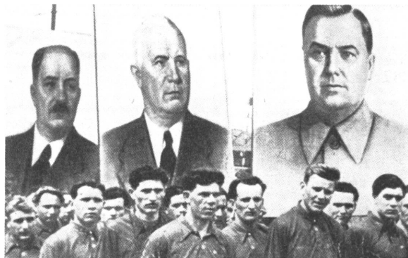
Arbeitermassen müssen hinter dem Eisernen Vorhang vor den Bildern Mikoyans, Chruschtschews und Malenkows verehrend vorbeiziehen, von denen der mittlere die beiden andern gestürzt hat.