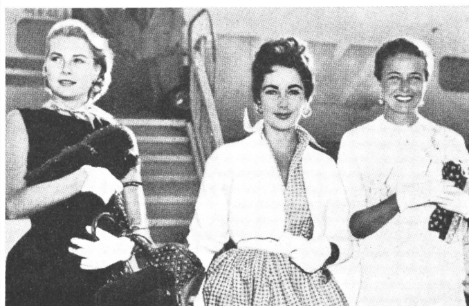
Grace Kelly, welche für ihre Rolle in dem neuen Film «The country girl» einen Oscar erhalten hat (links), auf einer Flugreise mit Elisabeth Taylor (Mitte).