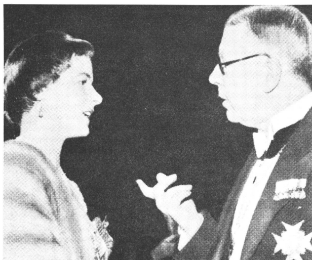
Ingrid Bergmann, die in ihrer Heimat sehr unfreundlich aufgenommen worden war und nie mehr nach Stockholm zurückkehren will, im Gespräch mit König Gustav von Schweden.