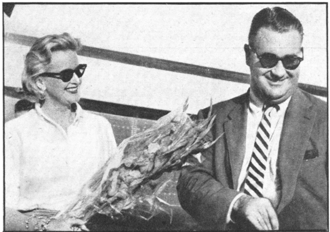
Robert Aldrich, der Regisseur des in dieser Nummer besprochenen Films «Attack», mit seiner Frau. Der Film führte in Amerika zu heftigen Polemiken wegen seiner Vorurteilslosigkeit.

Persönlich lebt er ganz zurückgezogen, schon weil er überaus stark kurzsichtig ist, was ihm die Teilnahme an allen öffentlichen Veranstaltungen unmöglich macht. In den Vorstellungen sitzt er zuvorderst, mit einem großen Feldstecher bewaffnet. Seit einiger Zeit ist er allerdings auf große Reisen gegangen, wie man munkelt im Auftrag der Hollywooder Filmindustrie. Er hält sich dabei längere Zeit auch in den europäischen Städten auf, offenbar, um Hollywood mit dem zu beliefern, was es am dringendsten braucht, Stoffe, Talente, Voraussagen und Berichte über die europäische Kundschaft, die für Amerika immer wichtiger geworden ist.