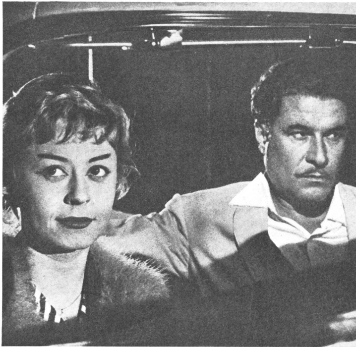
Giulietta Masina dreht nach der «Strada» einen neuen Film ihres Gatten Fellini, wo sie wieder eine arme Enterbte darstellt, die trotzdem das Leben liebt. Hier ist sie mit Amadeo Nazzari zusammen. («Die Nächte der Gabiria».)