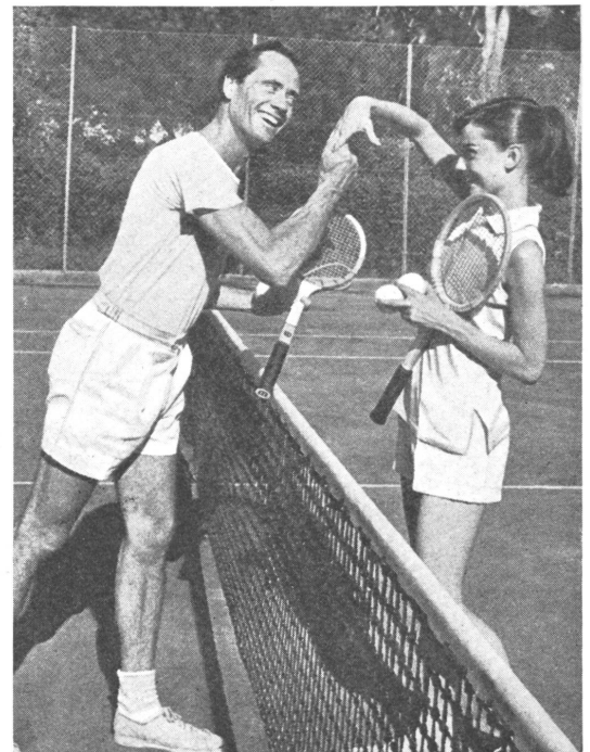
Mel Ferrer spielt mit seiner Frau Audrey Hepburn Tennis. Sie besitzen auf dem Bürgenstock ein Chalet.