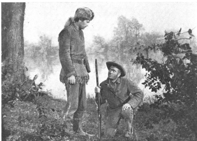
Davy Crockett, der tapfere Trapper (links), ein Kämpfer für das Recht im Wilden Westen, in Amerika noch heute unvergessen.

kanischen General Santa Ana, der in der ersten Hälfte des vergangenen Jahrhunderts New Mexiko aus dem amerikanischen Staatenbund raubte, fiel er, ein Held der Freiheit, ein Liebling des Volkes. In den Liedern wurde er besungen, in den Balladen gefeiert. Legende und Wunschbild legten sich um seine Gestalt, und das Andenken an ihn ist bis heute nicht erloschen. Er war ein großer Mann, im doppelten Sinne des Wortes. Und die amerikanische Nation huldigt ihm.