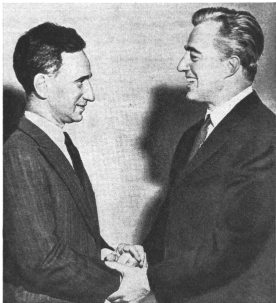
Zwei Filmleute von geschichtlicher Bedeutung sehen sich: De Sica trifft während seines Amerika-Aufenthaltes mit dem Regisseur Elie Kazan zusammen ( der u. a. «Die Faust im Nacken» schuf).

Schließlich fand er die Eingangstüre zu den Anlagen, die Chaplin bald darauf verkaufen sollte, und wurde nach scharfer Kontrolle von den ihn erwartenden Wärtern zu Chaplin geführt. Dieser war gerade mit der Montage des Films «Limelight» beschäftigt. Dabei war er in eine Klemme geraten; er fand den Uebergang von einer Szene zu einer andern nicht und wußte nicht, wie er den Film an dieser Stelle schneiden solle. In einer halben Stunde hatte er dann aber mit Sicas Hilfe die Lösung gefunden und führte seinen Gast in den Studioanlagen herum. Im Magazin fand dieser die berühmte Hütte aus dem «Goldrausch» wieder, ferner die Straße mit den Häusern von «Monsieur Verdoux», und die Gartenecke aus «Lichter der Großstadt». Es war für den ergriffenen De Sica ein unvergeßlicher Nachmittag, der mit einer Vorfüh-