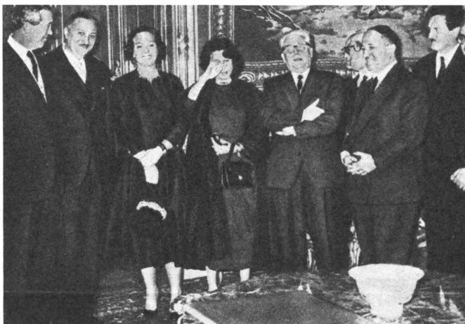
Die Preisträger des «Silberbandes» beim italienischen Staatspräsidenten. Links John Huston, in der Mitte Anna Magnani, neben ihr Staatspräsident Gronchi (mit Brille), neben diesem Zavattini, ganz rechts Germi.

ZS. Alljährlich werden in Italien von den Filmkritikern die «Nastri d'argento», die Silberbänder für die besten Jahresleistungen auf dem Filmgebiete verteilt. Es sind die höchsten Filmauszeichnungen, welche das Land kennt, eifersüchtig umworben und festlich verteilt. Dieses Jahr war man auf die Entscheide besonders gespannt, denn die italienische Filmproduktion hat bekanntlich ein schlimmes Jahr mit Konkursen und Mißerfolgen hinter sich, und die Auswahl an guten Filmen war klein. Die Entscheide sind denn auch sehr rasch gefallen,