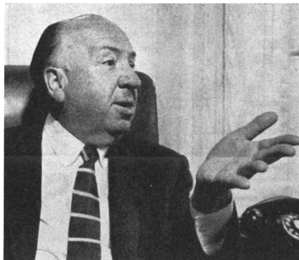
Hitschcock, der König der Reißer, der gerne auch andere Filme gedreht hätte, was sein Publikum aber nicht zuläßt.

Er weiß, daß er ein für allemal abgestempelt ist. Er hat sich auch auf andern Filmgebieten als dem Reißer versucht, aber nie mit Erfolg. Erscheint irgendwo sein Name auf einem Filmband, so wäre das Publikum maßlos enttäuscht, wenn nicht bald eine Nerven- und Rückenmark kitzelnde Situation erschiene. Es ist von ihm gesagt worden, daß, selbst wenn er einen Film über das Aschenbrödel drehen würde, das Publikum in der Hochzeitskutsche auf der Leinwand