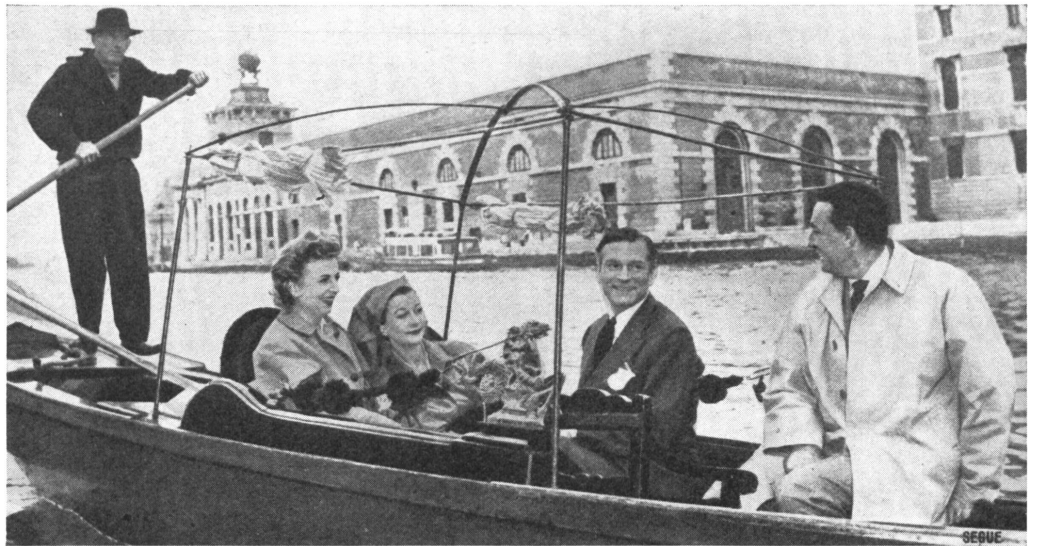
Vivien Leigh (dritte v. links), die vergeblich f. d. Fortbestand d. Theaters kämpft, mit ihrem Mann (zweiter v. rechts) in Venedig.

ZS. Im französischen Radio wurde berichtet, daß in Englisch-Guyana, also in Südamerika, die Kommunisten bei den letzten Wahlen die