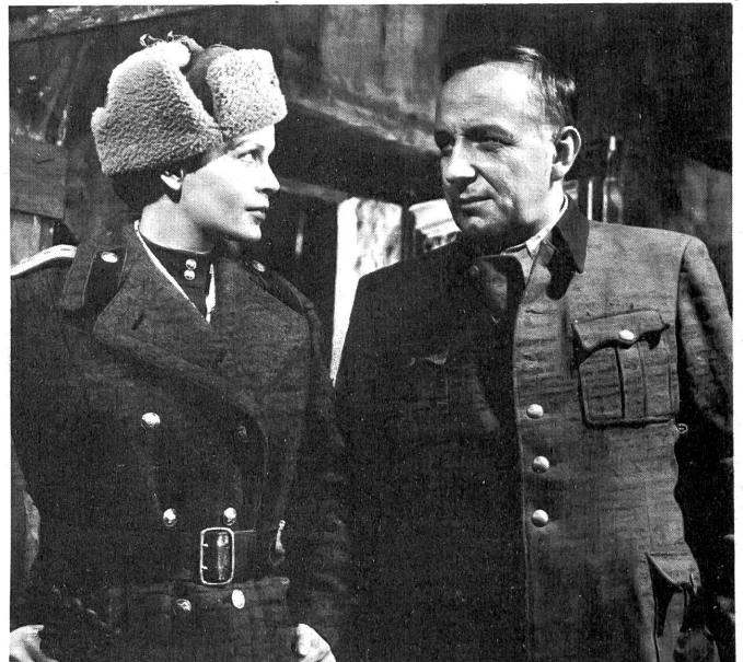
Die russische Aerztin und der gefangene deutsche Arzt: Menschlichkeit über den eisernen Vorhang?

Das ändert allerdings nichts daran, dass er, mit der nötigen kri- tischen Einstellung betrachtet, trotzdem sehenswert ist, denn Radvanyi hat es hier wiederum verstanden, nicht nur sehr gute Bilder zu erzeu- gen, sondern auch durch eine gewandte Regie manche der romanhaften Klippen bemerkenswert zu umfahren, naheliegende, feuchte Sentimen- talitäten elegant zu überspringen, überhaupt Plattheiten zu vermeiden. Seiner Herkunft und seiner Absichten wegen konnte es kein grosser Film werden (abgesehen von den kommerziellen Kompromissen), aber er ist doch ein bemerkenswerter Versuch der tastenden Auseinander- setzung mit dem für Deutschland lebenswichtigen russischen Problem und dem russischen Menschen. Sicher nicht den Tatsachen entsprechend und mit manchen geschäftlichen Konzessionen, aber von einer anständigen Grundhaltung und in der Form überdurchschnittlich.