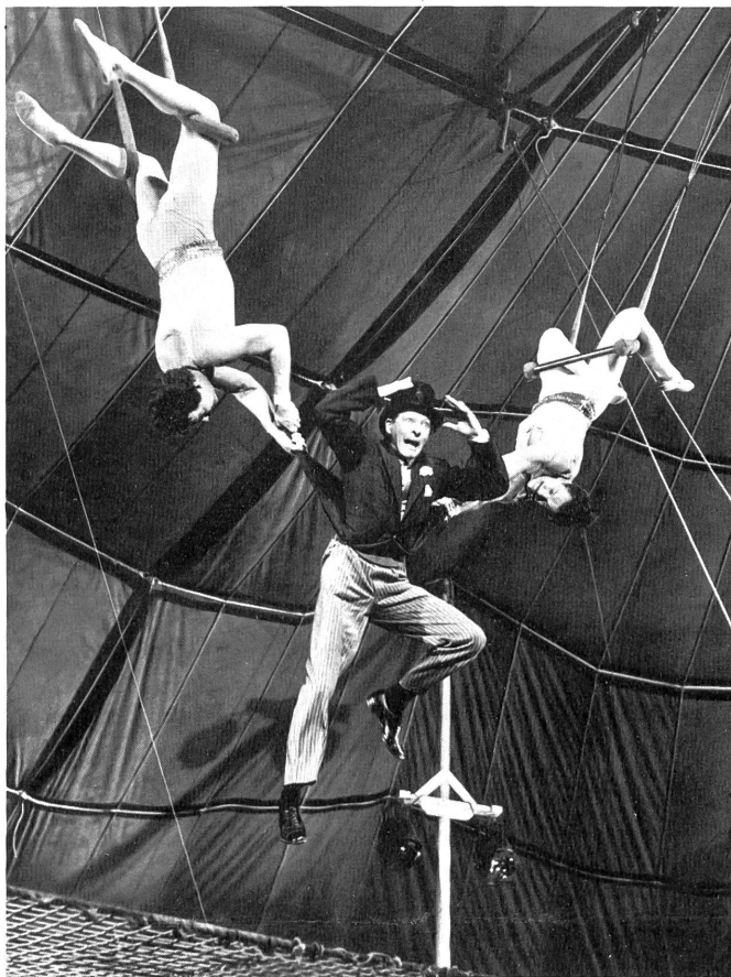
Danny Kaye, hochbegabter Schauspieler und Komiker, als Archäologe, der auf sonderbaren Wegen in einen Zirkus gerät. ("Der König der Spassmacher")

letzt hat der Film die überwältigend originelle Idee, alle Konflikte durch ein neu auftauchendes Findelkind lösen zu lassen. Billiger geht es nicht mehr.