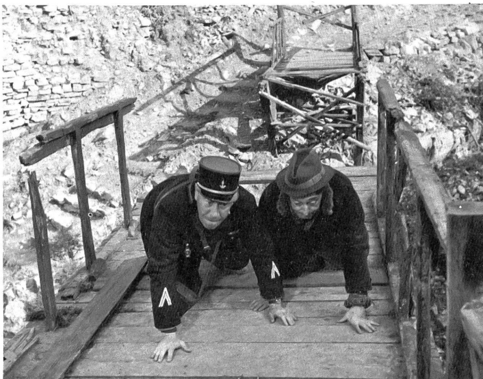
Fernandel und Toto sind die beiden köstlichen Gegenspieler in der Grenz-Komödie.