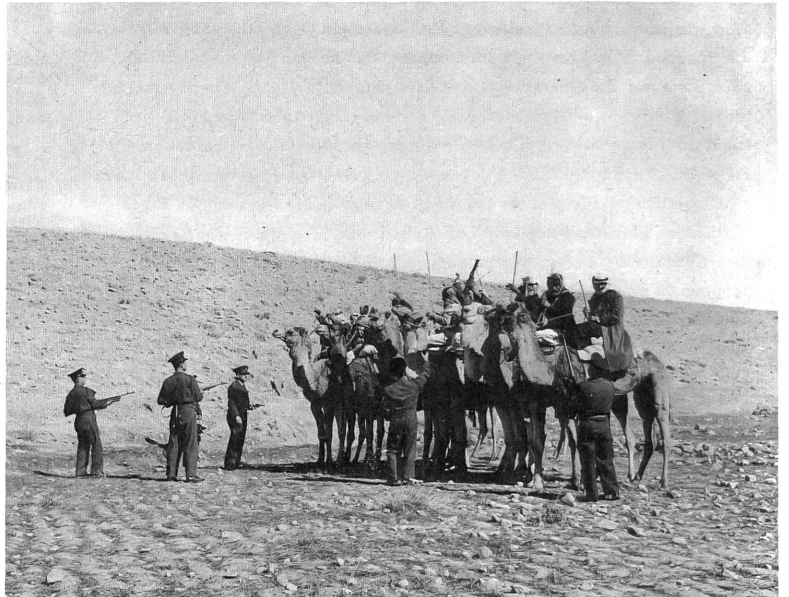
Ertappte, orientalische Rauschgiftschmuggler in dem ausgezeichneten Dokumentarfilm über Israel "Paradies und Feuerofen".

nacht zeigt. In grossartigen Einstellungen fängt dieser Dokumentarfilm das Nachtleben Londons ein, von der Riesenschlange vor den Lichtspieltheatern bis zu den billigen Strassenmädchen, die um Mitternacht noch keinen Freier gefunden haben. Besonders packend sind die Grossaufnahmen vieler, einzelner Gesichter, die für einen Augenblick aus der Masse auftauchen, ein eindrückliches Menschenporträt abgeben und dann wieder im Gewimmel der Acht-Millionen-Stadt verschwinden. Noch nie haben wir so wahr die Atmosphäre eines Spielsalons oder den gierigen Ausdruck eines spielenden "Teddyboys" geschildert gesehen. Dieser Film wurde 1956 gedreht und gehört zu den wenigen Streifen in unserer Zeit, die ganz auf das gesprochene Wort verzichten und allein durch das Bild erzählen - ein Vorbild für alle jene Filmschaffenden, denen an einer ernsthaften und wahrheitsgetreuen Schilderung irgend eines "Milieus" gelegen ist.