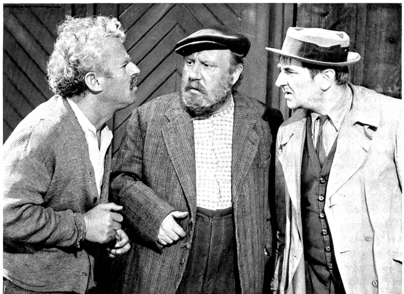
Die drei Zürcher Clochards in Verlegenheit, -ein weibliches Wesen ist in ihren angestammten Schlafplatz eingedrungen.

In der szenischen Abfolge ist der Film beschwingt. Er hat zwar einige Schwerfälligkeiten, ist dann und wann verschleppt, doch ist er im allgemeinen leichtgängig, hat Charme und versteht es, seine Klein-Moritz-Mentalität verschmitzt darzubringen. Am wenigsten gelungen sind die Szenen im reichen Haus, wo Früh zwar sich der erfreulichsten Kürze befleissigt, gerade dadurch jedoch nicht um das Kabarettistische herumkommt, das den angestrebten und in den eigentlichen Clochards- und Bahnhofszenen zweifellos erreichten Stil der atmosphärischen Richtigkeit verletzt. Im ganzen aber ein Film, bei dem man sich gut unterhält, dessen formale Formel Spass macht - das Rezept der Moritat ist gegenwärtig ja vielbenutzt - und der beweist, dass man auch bei uns eine Komödie drehen kann, die auf die billigsten Effekte verzichtet.