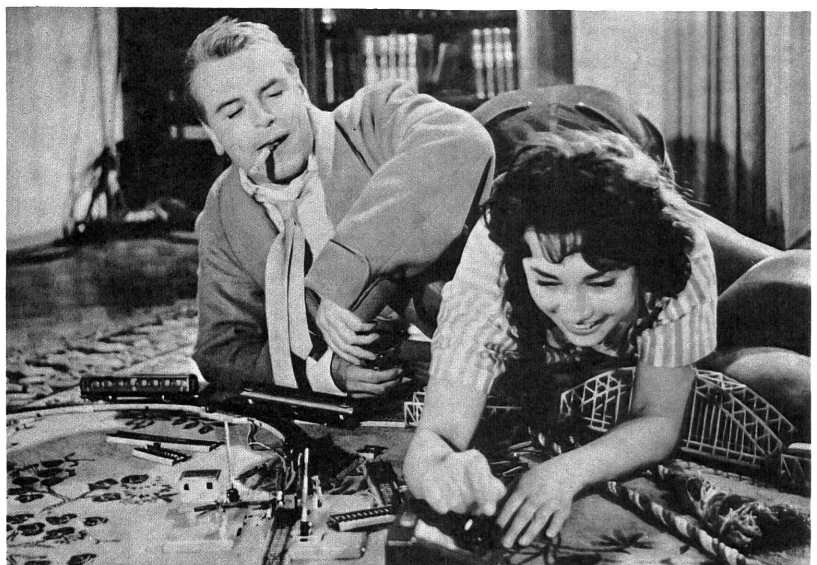
Sie kann besser Eisenbahn spielen als er - in der gescheiterten, deutschen Komödie "... Und das am Montagmorgen".

ms. Der englische Autor J. B. Priestley ist mit einem kleinen Boulevardstück diesem deutschen Film, den der Italiener Luigi Comencini inszeniert hat, zu Pate gestanden. Es ist die Geschichte eines arbeitsamen Mannes, der seine Tage als Filialleiter einer Bank verbringt, nervös und überarbeitet ist, keine Freude des Lebens kennt ausser Schaffen und dennoch oder gerade deswegen eines Tages sich entschliesst, den Narren zu spielen, das Bureau zu verlassen und seine Tage mit Trompetenblasen und Eisenbahnspielen zu verbringen. Selbstverständlich entsteht darum ein grässlicher Wirrwarr, die Psychiatrie wird zu Hilfe gerufen, doch die unvernünftige Vernunft des Streikenden ist gescheitert als die vernünftige Unvernunft der Medizin, des Generaldirektors und der ganzen arbeitstüchtigen Lebensfakerei. Schliesslich zwar kehrt der Rebell wieder in sein Bureau zurück, doch hat er unterdessen sein Herz in Liebe verloren und dadurch eine neue Daseinsfülle gewonnen, so dass er ruhig das Blasen auf einer Kindertrompete aufgeben und die tägliche Arbeit wieder aufnehmen darf. Der Film ist mehr nicht als ein heiterer Schwank, auf fröhlichste und geschmackvollste Weise von Comencini inszeniert, auf Wunsch des deutschen Produzenten zwar mit einiger unzugehöriger Erotik versehen, doch munter und gescheit gespielt, vor allem von O. A. Fischer, der beinahe britisch unterspielt, jedenfalls aus der Boulevardrolle ein kleines Kabinettstück seiner reifen schauspielerischen Kunst macht.