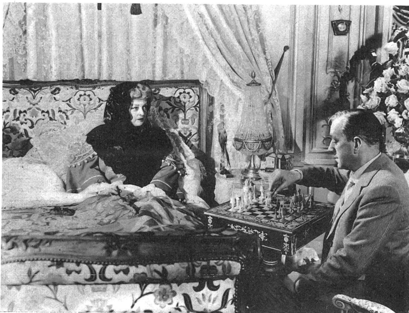
Die grosse Bette Davis in einer kurzen, aber glanzvoll gespielten Rolle im "Sündenbock".

durch die Atmosphäre des Milieus und die hohe Kunst der Schauspieler (unter ihnen in einer kleinen Rolle die grosse Bette Davis) der Film hoch über den langfädigen Roman hinausgehoben.