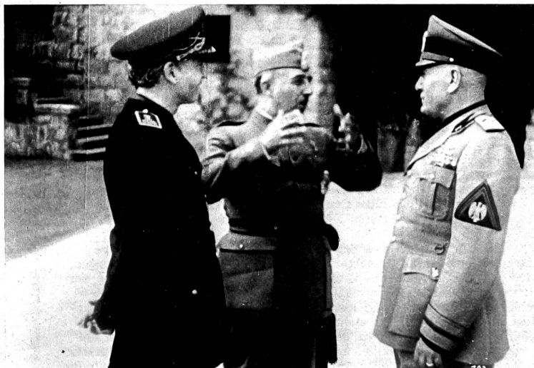
Franco mit Mussolini im Film "Diktatoren", ein Bild, das in Deutschland herausgeschnitten werden musste.

Leider ist die Gestaltung des Films sehr ungleich; Kogon hat keinen entsprechenden Gestalter gefunden. Die Bilder sind etwas zerfahren, es lässt sich keine Leitlinie erkennen, geschweige eine Steigerung oder dergleichen. Der geistige Gehalt ist dünn, wir erfahren sozusagen nichts über die Entstehungsursachen der Diktaturen und auch nichts über die Gründe der Ausstrahlungskraft ihrer Träger auf die Völker, für uns Schweizer doppelt rätselhaft. Wer sich jedoch für politische Stoffe interessiert, wird nicht ganz ohne Gewinn bleiben.