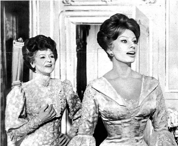
Sofia Loren, die im internationalen Film immer stärker hervortritt, setzt sich auch als Olympia mit ihrem Charme durch.

ms. "A Breath of Scandal" - ein Hauch von Skandal, ach wär' es doch nur wahr in diesem Film. Sittsam geht's zu, und die Heiterkeit, zu welcher der "Skandal" anstiften will, ist etwas lahm. Ferenc Molnars "Olympia" wurde von Michael Curtiz in Wien verfilmt. Sophia Loren spielt die k. und k. -Prinzessin, die einen reichen smarten Amerikaner liebt, dennoch nicht auf den Adelsstand verzichten will und darum in die Ehe mit einem preussischen Grafen geht, der zwar Stand, aber nicht so viel Charme wie der verlassene Amerikaner hat. Curtiz hat diesen Stoff zu einer Wiener Operette umgemodelt, zu einer Operette aber ohne Musik. Denn dass die bunten Farben und der Barock von Schönbrunn die Musik ersetzen könnte, darf man wohl im Ernst nicht behaupten. Es geht also dezent heiter zu, es erklingt kein Walzer, und das Lächeln ist ohne Ironie. Eine Parodie wäre am Platze gewesen, aber zu einer Parodie hat sich Michael Curtiz, dessen Wiege ebenfalls in der Donaumonarchie gestanden hat, aus Heimweh nicht entschließen können. So lässt er die Loren schön und verführerisch sein, John Gavin smart und charmant, und den in Liebesdingen (laut Drehbuch) verständigen und fachmännischen Maurice Chevalier macht Curtiz zum gewandten Präzeptor, der die Prinzessin lehrt, dass man zwar wohl ein Lächeln lang in der Liebe emanzipiert sein darf, aber seines Standes bewusst bleiben muss - für die Dauer der Ehe.