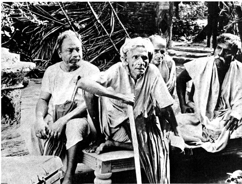
Neben der Jugend das Alter; das Gefühl der Grenzenlosigkeit in der Generationenfolge findet einen gültigen Ausdruck in "Pather Panchali"

Schon einmal ist versucht worden, dieses natur-geistige Leben Indiens in das bewegte Bild einzufangen: von Renoir in seinem "Strom". Regisseur Ray war bei jenen Aufnahmen dabei und hat wohl daraus die Anregung zu diesem Film geschöpft. Dort lebte eine europäische Familie in dieser Welt, die aber ihre europäische Aktivität und die Selbstständigkeit der Weissen noch behalten hatte und nicht derart im Werden und Vergehen aller Dinge eingebettet dahintrieb. Von Hause aus Maler, hat Ray diesen "Pather Panchali", der ursprünglich ein volkstümliches Kinderbuch gewesen ist, illustriert. In der Folge aber, leidenschaftlich dem Film ergeben, hat er es in dieser vertieften Weise nach westlicher Art zuerst mit eigenen Mitteln, und als diese nicht ausreichten, mit Unterstützung der Regierung von Bengalen 1955 gedreht. 1956 erhielt der Film in Cannes einen Spezialpreis als "Document humain", der jedoch umstritten war; der langsame Rythmus des Geschehens war vielen Europäern zu monoton. Der Film gehört einer Trilogie an, deren zwei andere Filme sich jedoch nicht im gleichen Mass durchsetzen konnten. Gegenwärtig arbeitet Ray am Film "Kanchenjunga" mit teilweise den gleichen Schauspielern.