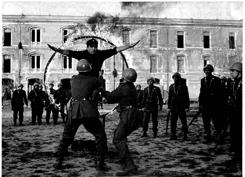
Der martialische, entschiedene Fascist, der sich schliesslich zu menschlicher Redlichkeit zurückfindet, ist Gegenstand des gut gespielten Films "Der letzte Fascist".

Georges Wilson seinerseits ist ein so grosser Schauspieler, dass es ihm wenig Schwierigkeiten macht, eine Figur des Skurrilen, wie die dieses Professors, zu jenem Ernst und zu jener Unbedingtheit zu läutern, die nötig sind, damit die menschliche Begegnung zwischen den beiden Männern glaubhaft wird.