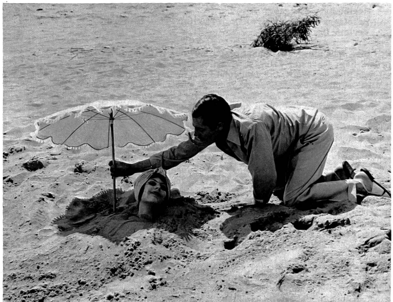
Eine scharfe Satire auf das in Italien geltende Ehrerecht und die Folgen der dortigen Unauflöslichkeit der Ehe bringt Germis Film "Scheidung italienisch"

Die Episodenreihe ist künstlerisch nicht sehr wertvoll, sie vermag bestenfalls in hämischer Weise kichernd zu unterhalten, reichlich frivol zu amüsieren auch, derart, dass der Rezensent mit Einwänden der Moral allerhand auszurichten hätte. Dem Konsumenten dieser Spässe muss zugelfüstert werden, dass es bereits mit zur achten Sünde gehört (Lust auf filmische Pikanterien), diese Frivolitäten zu goutieren.