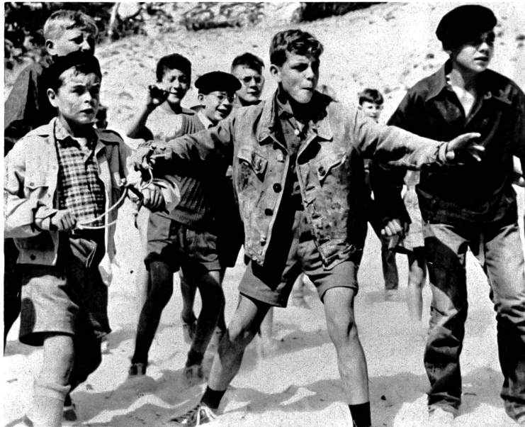
Keine Autorität vermag die entfesselte Kampfeslust der Buben im Film "Die Rasselbande" zu zähmen.

Yves Robert erzählt, die Geschichte mit Spontaneität, fröhlichen Herzens und viel Liebe zu den Kindern, die er hervorragend zu leiten versteht: es ist ein herrlicher Spass, diese Buben sich selber spielen zu sehen: ihr Temperament sich entfalten zu sehen. Jugendlich wird man selber wieder bei ihrem Anblick, es ist als sässe man in einem Jugendbrunnen und bade sich frisch an so viel Frische, Unbekümmertheit und guter Art in allem rüden Handwerk des Bubenkrieges von Dorf zu Dorf.