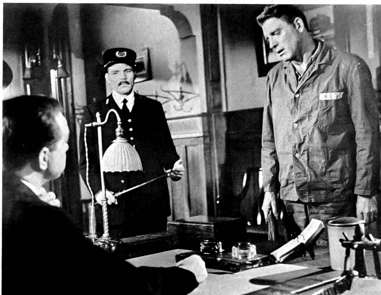
Fehlende Erziehung und Unbeherrschtheit machen in jungen Jahren aus dem "Gefangenen von Alcatraz" einen Totschläger

Man weiss, dass Robert Stroud, wegen Mordes zum Tod verurteilt, dann zu lebenslänglichem Zuchthaus in Einzelhaft begnadigt, in seiner - jetzt 52 Jahre dauernden - Gefängniszeit sich aus eigener Kraft zu einem Ornithologen internationaler Anerkennung ausgebildet und ausserdem eine sechsbändige, freilich durch das FBI mit dem Veröffentlichungsverbot belegte Geschichte des Strafvollzugs in den Vereinigten Staaten geschrieben hat. Das Schicksal dieses Mannes dient in einem gesellschaftskritischen Sinne John Frankenheimer zu einer gerade durch ihre Mässigung wirksamen Kritik am amerikanischen Gefängniswesen, gibt darüber hinaus aber, ganz klar und gewollt, das realistische Beispiel einer Freiheit im Geiste, die zum Massstab wird für die vermeintliche Freiheit derer, die nicht hinter Gefängnisgittern sitzen. "Birdman of Alcatraz" ist einer jener Filme, mit denen die Amerikaner ohne grosses Aufheben zu einer Selbstkritik ansetzen, die voller Würde ist, weil sie das Mass bewahrt, voller Unbestechlichkeit ist, weil sie sich auf die Akten stützt, und die zu leisten es auch Mut und Energie brauchte, nachdem das FBI mit allen Mitteln versucht hatte, dem Film schon vor seiner Produktion den Garaus zu machen. Seine Erheblichkeit mag darin erkannt werden, dass Justizminister Robert Kennedy ihn durch seine Zustimmung auszeichnete.