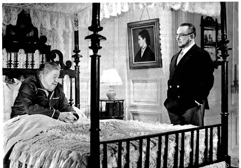
Michel Simon (links) als das in die "gute Familie" einbrechende schwarze Schaf im Film "Madeleine und der Seemann"

No. 1066: Ein Denkmal für Henry Dunant - Bürgersinn in Viano - Berlin grüsst Basel - Judo-Europameisterschaften in Genf - Belgischer Sieg in der Tour de Romandie