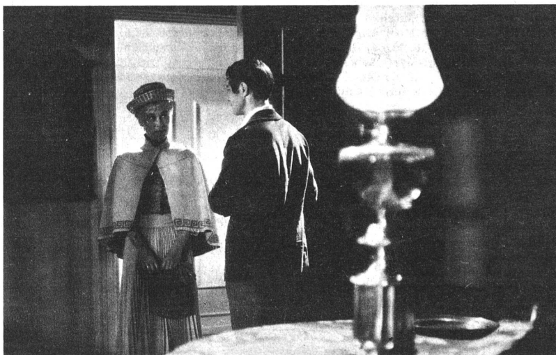
Falsche Vorstellungen über Liebe und Ehe lassen die Frau in dem in Venedig gezeigten, streng stilisierten neuen Film von Dreyer "Gertrud" scheitern.