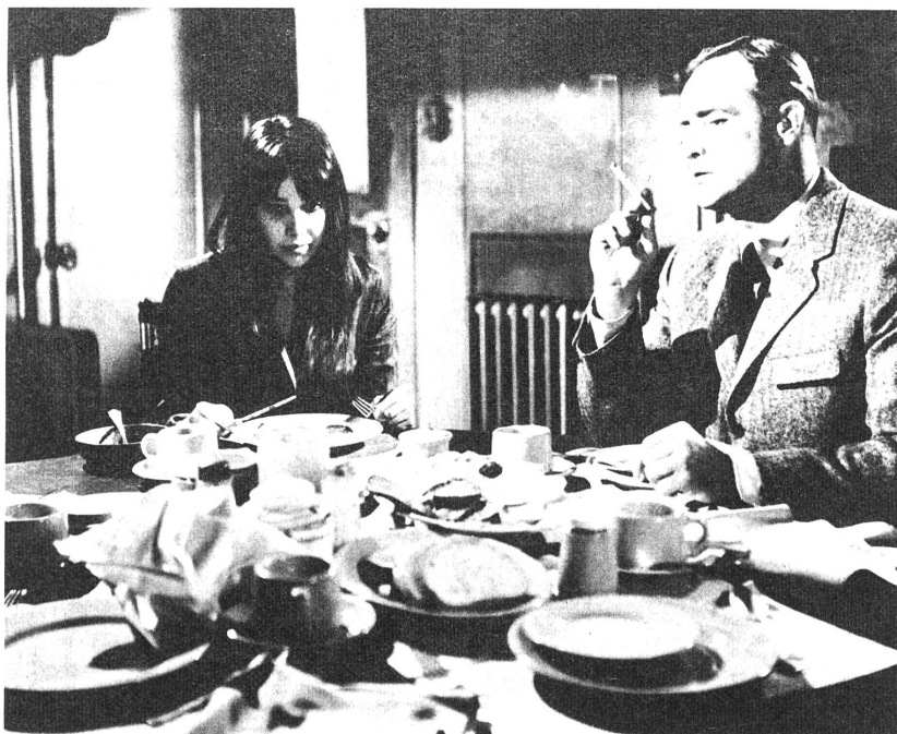
Brando als britischer Agent mit einem geretteten jüdischen Flüchtling in dem Anti-Kriegsfilm "Morituri".

Die Spannung ist im allgemeinen durchgehalten, die Sinnbedeutung wird greifbar, ohne dass sie zu stark betont würde. Schwächen treten dennoch nach vorne: Verzeichnung einiger Figuren, ins Karikaturenhafte, Nachgiebigkeit gegenüber Szenen und Einzelheiten, die als publi-