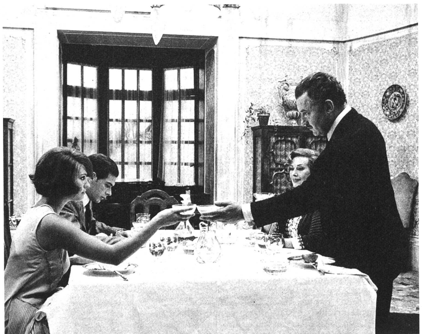
Die gebrochen-apatheische Familie und ihr Bedrücker in dem pessimistischen Film "Die Gleichgültigen"

Michael Anderson ist ein Regisseur, der künstlerisch kein besonderes Profil besitzt. Aber er hat "Operation Crossbow" mit dem jedem Könner eigenen Geschick für Spannung und dramatische Valeurs in Szene gesetzt. Einige gute Schauspieler - so George Peppard als leitender Agent - treten in ihren Heldenrollen in den Vordergrund, einige Charakterdarsteller füllen den Hintergrund, aus dem Teil lediglich die Figur Duncan Sandys hervorsticht, der die Aktionen des Geheimdienstes und der Luftwaffe gegen die Forschungszentren der Deutschen für Flugbomben (V 1) und Raketen (V 2) leitete.