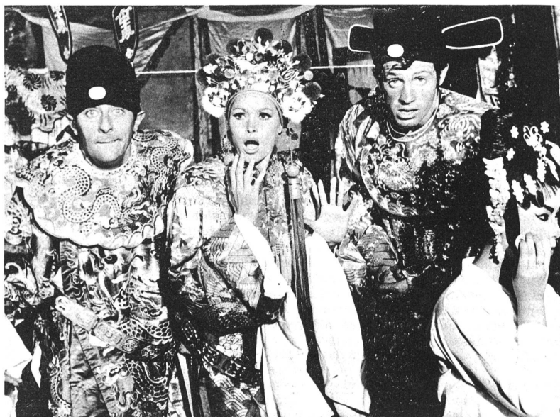
J. P. Belmondo (rechts) in der turbulenten Parodie "Die tollen Abenteuer des Monsieur L."