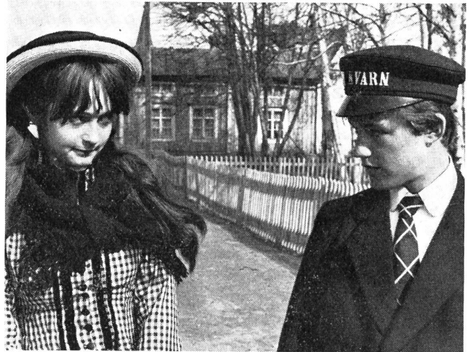
Erste Begegnung des jungen, armen Nord-Schweden mit dem andern Geschlecht in dem von der Interfilm in Berlin ex aequo ausgezeichneten, schwedischen Film «Hier hast Du Dein Leben»

Das alles könnte eine witzige Satire auf verschiedene Auswüchse werden, besonders, weil ein Mann von unbestreitbarem filmischen Können sich der Sache annimmt. Manches auf diesem Gebiet bietet Angriffsflächen genug. Auch die Kirche — wir haben noch nie so skrupellos berechnende Geistliche auf der Leinwand gesehen — wäre