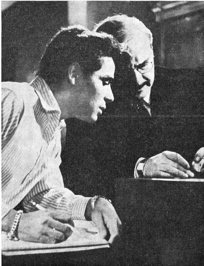
Hier gibt der «Pfandleiher» dem Gehilfen, der sich nachher für ihn opfert, Erklärungen.

Wir haben ihn bereits in unserm Filmbericht von 1964 über das Festival von Berlin besprochen und haben die damaligen, packend-schmerzlichen Eindrücke auch beim Wiedersehen bestätigt gefunden. (FuR, 16. Jahrgang, Nr. 16, Seite 4). Was für ein leidvolles Geschehen! Im dunkeln New Yorker Viertel von Spanisch-Harlem vegetiert ein hartherziger Pfandleiher, der sich in der Abhängigkeit von Gangstern befindet, die regelmässig Zahlungen von ihm verlangen. Einsam und abgekapselt lebt er nur für sich, jedem Gefühl scheinbar abgestorben. Das alles ist menschlich verständlich, denn er ist kein gewöhnlicher Wucherer, sondern ein ehemaliger Professor aus Leipzig, der erleben musste, wie seine Frau im KZ schamlos geschändet und totgeschlagen wurde, wie seine Kinder elendiglich ermordet wurden. Ihnen in tiefer Liebe verbunden, kann er die grauenvollen Bilder nicht vergessen.