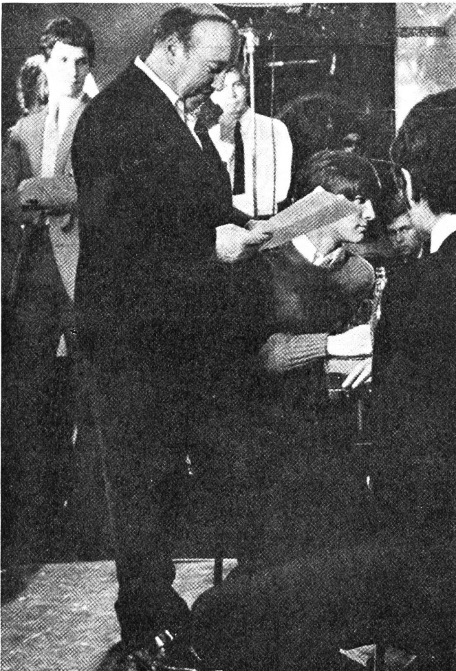
Marcel Carné, einst Schöpfer grosser Filme, bei den Aufnahmen «Die jungen Wölfe», bei denen ihn seine Gestaltungskraft endgültig verlassen hat.

CS. Die Reklame lügt: glücklicherweise. Dieser Film ist kein üblicher Agentenfilm. Seine Spannung ist intensiv, auf äusserliche Effekte wird weitgehend verzichtet. Raoul Lévy gibt hier erneut eine vielversprechende Talentprobe. Wissenschaftler werden, wenn es dem Staat nützt, manipuliert, ausgenutzt, erpresst. Und das in Ost und West. Ein amerikanischer Forscher reist nach Ostdeutschland, um dort einen russischen Kollegen zu treffen, der ihm einen Mikrofilm aushändigen will. Die ostdeutsche Geheimpolizei ist informiert; sie bedient sich ihrerseits wie die CIA eines Forschers, dem es obliegt, nicht den Mikrofilm zu beschaffen, sondern durch gespielte Freundschaft, die allmählich zur echten wird, den Amerikaner zu gewinnen. Beide sind Amateurspione gegen ihren Willen; beide sind bloss Bauern auf dem Schachbrett: Die grossen Drahtzieher kümmern sich weder um Gefühle noch um ermordete Wissenschaftler und trinken Whisky und Wodka. Nachdem es Clift gelungen ist, nach Amerika zurückzukehren, lässt sich der Deutsche, der nun seinerseits an dessen Seite schmutzig als Spion leben sollte, von einem Lastwagen überfahren: «Es ist besser so», sagt er noch.