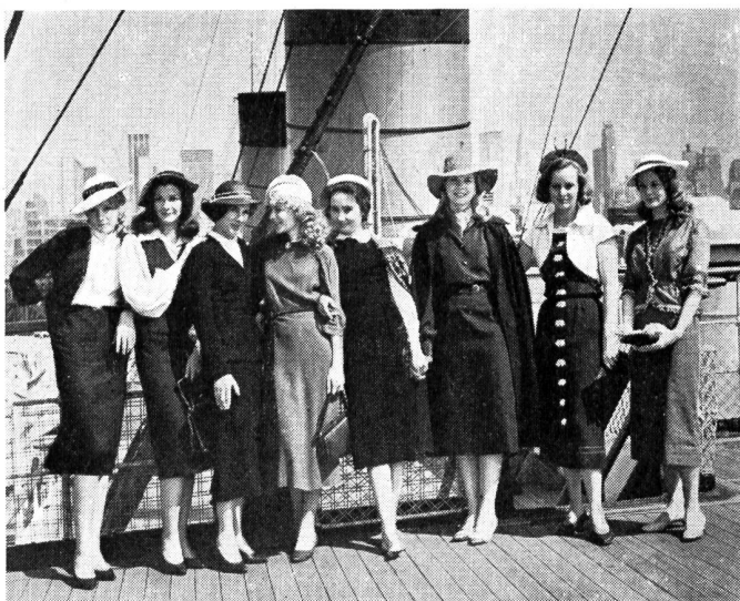
Acht junge Mädchen-Schicksale werden im Film «Die Clique» zu schildern versucht, leider allzu äusserlich clichéhaft.

Immerhin ist dem Film ein ernster und aufrichtiger Unterton geblieben, und wenn er auch einmal mehr als verpasste Gelegenheit anzusprechen ist, so stellt er doch