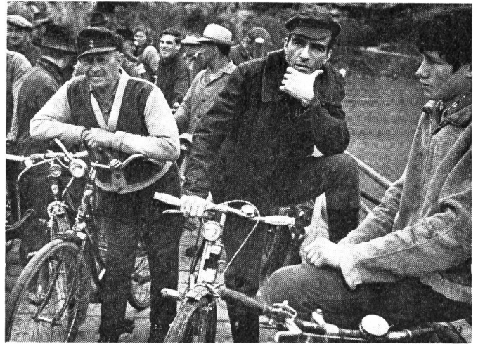
Eine der letzten Aufnahme des schon schwerkranken Montgomery Clift in «Lautlose Waffen» (Mitte). Er starb kurz darauf.