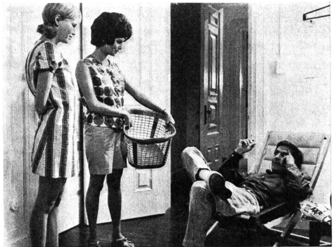
In «Rosemarys Baby» ahnt die Ehefrau (links) noch nicht dass ihr Mann der schwarzen Magie verfallen ist.

form, wie sie der Filmfreund aus den Werken von Alfred Hitchcock kennt? Wohl deshalb, könnte man spekulieren, weil diese Form wie keine andere sich eignet, eine Story gradlinig zu erzählen und gleichzeitig die Spannung — hervorgerufen durch einen unbestimmten Faktor — auf den Höhepunkt zu treiben. Doch gerade hierin unterscheiden sich Hitchcock und Polanski. Während beim Altmeister des Kriminalthrillers die Spannung auf ihrem Höhepunkt aufgelöst wird und für den Zuschauer das grosse «Aha-Erlebnis» stattfindet, setzt Polanski dort ein grosses Fragezeichen. Am Ende des Films beginnt bei ihm die Auseinandersetzung. Nichts wäre verheerender, als wollte man den Film auf den einfachen Nenner der Romanvorlage zurückführen, der einzig um einer spannenden Handlung willen, die Menschwerdung des Teufels schildert. Polanskis Werk lebt von der Reflexion, die darüber angestellt wird. Wer bloss hingehht, um einen Gruselfilm zu sehen, wird deshalb nicht auf die Rechnung kommen.