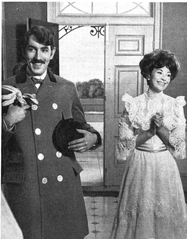
Eine gute und ulkige Komödie aus England ist «Ein Toter bei bester Gesundheit», die in Kostümen der viktorianischen Gesellschaft die heutige angreift.

Bryan Forbes inszeniert oft zu weich und lässt die Pointen viel zu langsam anlaufen, doch bringt er einen sehr ulkigen Film zustande, in dem sich England vom Bisherigen verabschiedet. Der Viktorianismus wird fein säuberlich durch's Teesieb passiert. Als Arzt, der einmal inmitten einer untadeligen bürgerlichen Umwelt einen falschen Totenschein zu viel ausgestellt hat (und auch sonst ist einiges schief gegangen) vegetiert Peter Sellers in einer Bude voller Katzen. Den Whisky schlürft er aus Reagenzgläsern und ständig erklärt er, einst bessere Zeiten gesehen zu haben. Ein zarter und leiser schwarzer Humor herrscht vor, dem unter anderem Michael Caine und Nanette Newman gekonnt Profil geben.