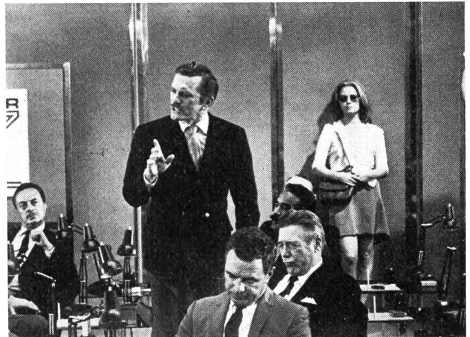
Der erfolgreiche Werbefachmann (Kirk Douglas) bei der Arbeit, während seine Geliebte im Hintergrund fühlt, dass er sein Bestes und Eigenstes hier nutzlos vertut. («Das Arrangement»)

Eine der zentralen Sequenzen — eine der schönsten, die uns die siebte Kunst je gegeben hat — zeigt die Absolutheit der Gefühle in diesem Werk auf, jene verrückte,