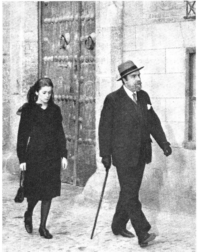
Die beiden Hauptfiguren im kritischen, in Cannes erstmals gezeigten Bunueelfilm «Tristana», Nichte und Onkel (Cathérine Deneuve und Fernando Rey)

Und dann kam Bunuel mit «Tristana», jedoch ausserhalb der Konkurrenz, und zwar ganz auf seinen ausdrücklichen Wunsch. Nach einem etwas enttäuschend-melodramati-