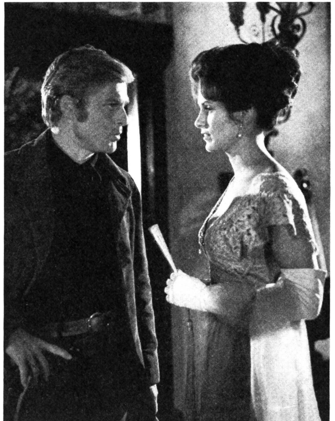
Auch die Weissen, hier der Sheriff und die Fürsorge-Aerztin, werden im Film «Willie Boy» kritisch betrachtet.

Das alles wird keineswegs in Wild-Westmanier, sondern zurückhaltend, beinahe mit einem Anflug romantischer Zärtlichkeit gestaltet. Polonski hat es ausgezeichnet verstanden, diesen Ton, durchtränkt mit leiser Traurigkeit, durchzuhalten. Unterstützt wird er dabei von grossartigen Schauspielern, die alle die Konflikte ihrer Umwelt ebenso zur