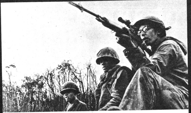
«The Quiet Mutiny» (Grossbritannien)