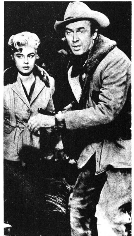
Redlicher und aktionsgeladener Western: James Stewart mit Partnerin Elaine Stewart in James Neilsons «Night Passage»

Der Film «Night Passage» (1957), den das Deutschschweizer Fernsehen unter dem Titel «Die Uhr ist abgelaufen» in deutscher Synchronisation zeigt, verschafft die Begegnung mit beliebten Stars und Charakterdarstellern des amerikanischen Films. James Stewart, einer